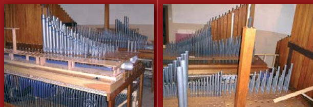
Wiatrownice nowych organów, pierwsze wstawione chóry głosów

zostały przewiezione do Sanktuarium Maryjnego w Dąbrówce Kościelnej gdzie dalej służą do liturgii.