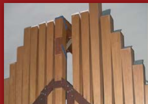
Z lewej największe piszczałki (głos językowy fagot), z prawej nowy kontuar

Wiatrownice i piszczałki zostały wykonane z drewna egzotycznego, daglezji oraz sosny, metalowe ze stopu cyny z ołowiem. Instrument posiada 3 miechy, dmuchawę cichobieżną firmy Laukhuff , aparat tremolo powodujący wibrację dźwięku.