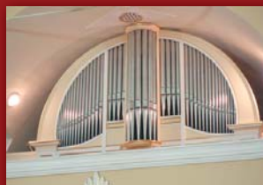
Nowy i stary prospekt organów

manuały (56 klawiszy) oraz klawiaturę pedałową (30 klawiszy), wolną kombinację, 4 stałe (programowalne), wyłącznik głosów językowych (pojedynczo i wszystkich).