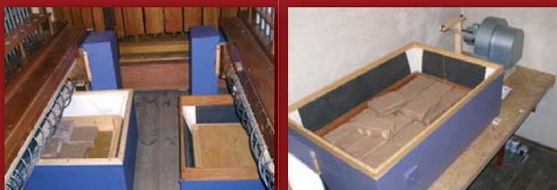
Miechy: z lewej pomocnicze, prawej główny z widoczną w tyle dmuchawą

Od września postępowaly prace przy budowie naszego instrumentu i zostały zakończone w marcu bieżącego roku.